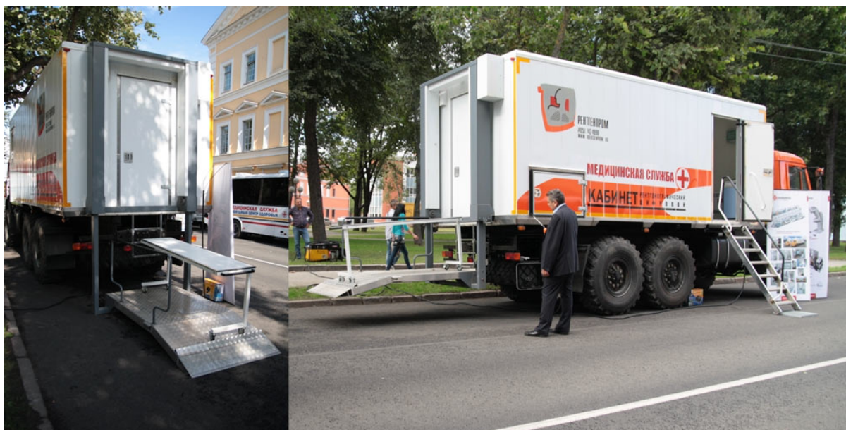
Лифтовое устройство для подъема пациентов

У дверей установлены тепловые завесы для холодного времени года. Комфортная температура поддерживается при помощи кондиционера. В случае необходимости, при низкой внешней температуре может использоваться дополнительная система обогрева всего кабинета.